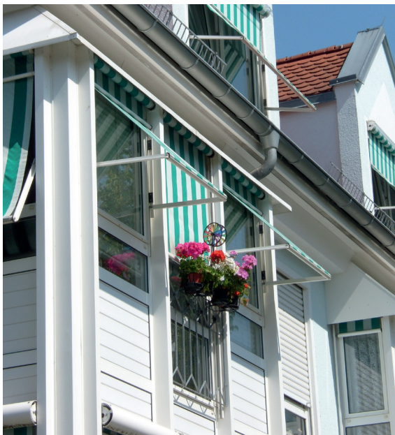
Wohnanlage Filderblick Kemnat

0711-44 00 97 33, S.Steimle@Ostfildern.de