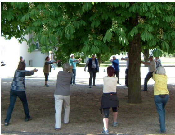
Bewegung und Spaß – B.u S.