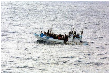
Flüchtlingsboot im Mittelmeer

Eine humane Migrationspolitik ist möglich!