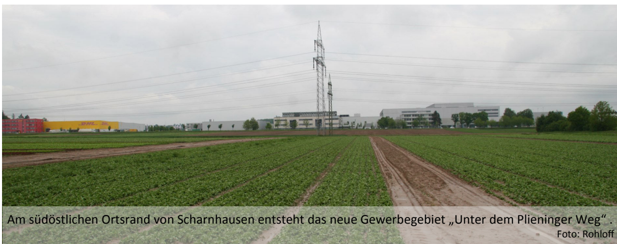
Am südöstlichen Ortsrand von Scharnhausen entsteht das neue Gewerbegebiet „Unter dem Plieninger Weg“.