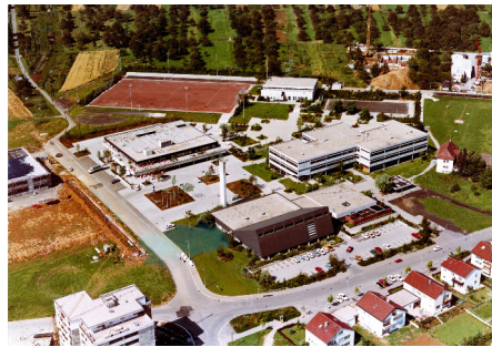
Neues Zentrum, 1972. Die Realschule (rechts) war das erste Schulgebäude im „Neuen Zentrum“. Sie wurde 1983 schließlich offiziell „Riegelhofschule Realschule Nellingen“ benannt. Links angeschnitten sieht man den Rohbau des OHG.