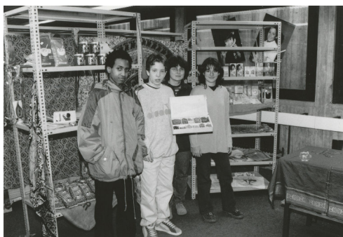
„Eine-Welt-Laden“, 1998. Schülerinnen, Schüler und eine Lehrerin bei der Präsentation ihres „Eine-Welt-Ladens“ in den Räumen der Realschule. Das Projekt dokumentiert das soziale Engagement in der Schule.