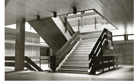
Treppenhaus der Realschule, 1969. Architekt Prof. Werner Luz entwarf einen modernen, kubischen Bau. Als Baumaterial wählte er Sichtbeton, der nicht verputzt werden musste. Die sichtbare Holzmaserung der Schalbreter sollte dem Gebäude eine „moderne, aber nicht unbehagliche Atmosphäre“ verschaffen.