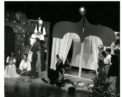
Aufführung eines Singspiels, 1988. Anlässlich des 20-jährigen Schuljubiläums 1988 führten Schülerinnen und Schüler ein Singspiel auf. Die musische Erziehung hat in der Realschule traditionell einen hohen Stellenwert.