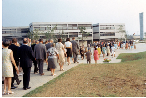
Einweihung des „Neuen Zentrums“, 1969. Am Anfang waren im Realschulgebäude auch das Otto-Hahn-Gymnasium (OHG) und die Hauptschule (später Erich-Kästner-Schule EKS) untergebracht. Das OHG zog 1972 in sein eigenes Gebäude. Die EKS zog 1976 in den zweiten Bauabschnitt des OHG um.

„Wir machen Schule für die Zukunft Ihrer Kinder“ Leitsatz der Realschule am Tag der Offenen Tür 2018.