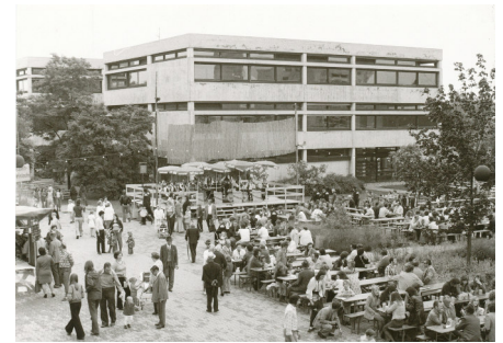
Schulfest, 1974. Die Realschule betonte schon früh den Wert der Schulgemeinschaft. Im Leitbild von 2006 ist formuliert, dass Schüler, Lehrer und Eltern ein Team bilden und an einem Strang ziehen.