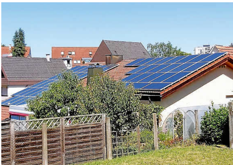
In der Stadt sind noch viele Dachflächen für die Energiegewinnung nutzbar.