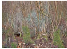
„Waldstück 22“, 2023

In diesen Prozess sind die Betrachterinnen mit einbezogen. Sie werden angesprochen, ihre Wahrnehmung sensibilisiert. Unwillkürlich stellen sich Fragen nach dem Werden, dem Leben und der Vergänglichkeit. Es gelingt Isabell Munck, einerseits hochästhetische Fotokunstwerke zu schaffen, die Baumriesen vor dem Hintergrund der sich abzeichnenden Klimakatastrophe, aber gleichzeitig als gefährdet und schützenswert darzustellen.