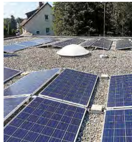
Die Sonne nutzen

Gleichzeitig stellt die Veranstaltung den Auftakt für eine Photovoltaik-Bündelaktion speziell für Mehrfamilienhäuser in Ostfildern dar, die die Stadt Ostfildern in Kooperation mit den Teckwerken und der Klimaschutzagentur durchführt. Wohnungseigentümergeinschaften und Hausverwaltungen, die eine Photovoltaikanlage auf ihrem Gebäudedach realisieren möchten, können im Nachgang der Veranstaltung ihr Interesse zur Teilnahme bekunden. Sie erhalten dann im ersten Schritt eine individuelle Beratung und Auslegung der Photovoltaikanlage, inklusive Kostenvorabschätzung. Die Beratungen erfolgen durch die qualifizierten Bürger-Photovoltaikberater der Teckwerke Bürgerenergie.