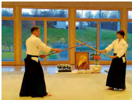
Beim Lehrgang am vergangenen Wochenende in Musberg wurde auch mit Waffen (hier: Stab) trainiert.