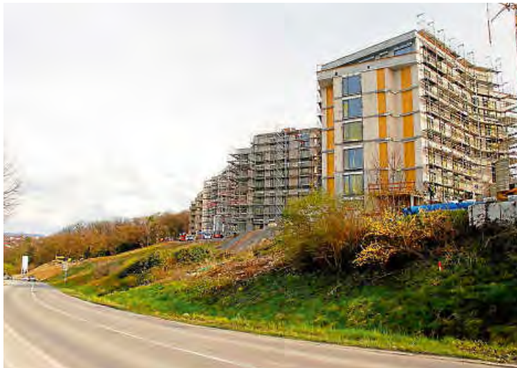
Der Bebauungsplan für das Gebiet ist rechtskräftig.

Jürgen Kleih (Bündnis 90/Die Grünen) stellte bei der langen Geschichte ein „ab-