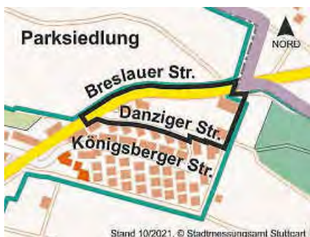
Karte: FB 3 / Planung

Die Grenzen des Geltungsbereichs des Bebauungsplans sind in dem abgebildeten Kartenausschnitt dargestellt. Maßgebend ist der Lageplan vom 21.09.2023 / 17.10.2023 mit Textteil vom 21.09.2023 / 26.10.2023 des Fachbereichs 3 / Planung der Stadt Ostfildern, der Bestandteil der Satzung ist.