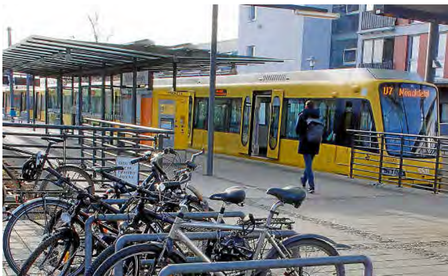
Seit 23 Jahren fährt die Stadtbahn bis nach Nellingen.

Corina Raisch (Freie Wähler) sagte, ihre Fraktion schätze die Stadtbahn sehr, „ist sie doch aus unserem Alltag in Ostfildern als ein zeitgemäßes Transportmittel nicht mehr wegzudenken. Zu einer funktionierenden Stadtbahn gehört natürlich auch die Modernisierung. Es geht um Sicherheit und zeitgemäßen Fahrkomfort für alle Nutzer, und daher stimmen wir der Vorlage gerne zu“, sagte sie. pst