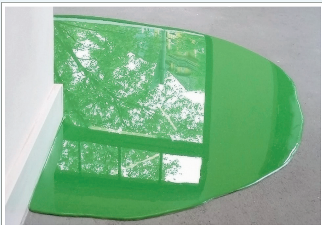
Abb. oben: Rainer Splitt „Farbguss (Düsseldorf/grün)“, 2012