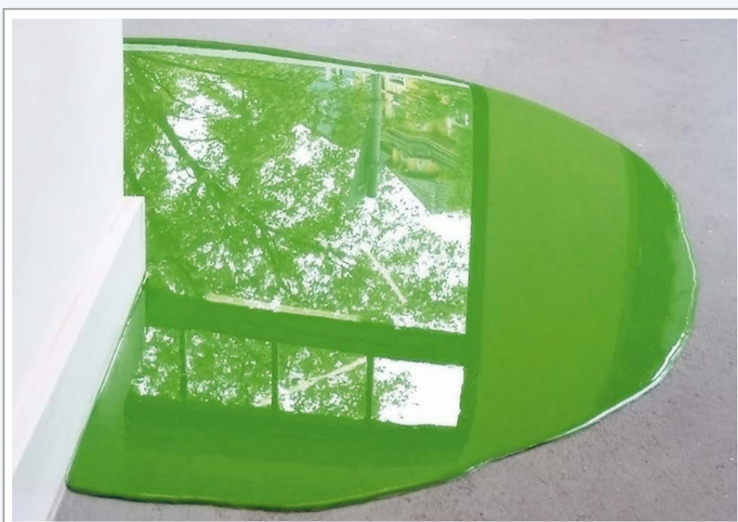
Abb. oben: Rainer Splitt „Farbguss (Düsseldorf/grün)“, 2012