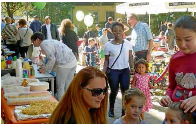
Ein Fest lockt Besucher an.

Die verkaufsoffenen Sonntage sind nicht nur eine Gelegenheit für Einkäufe, sondern auch eine Möglichkeit, vor Ort das lokale Gemeinschaftsleben zu erleben und zu unterstützen. eis