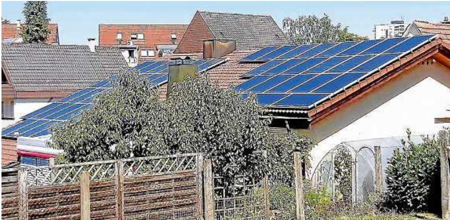
Eine Photovoltaikanlage produziert Strom ohne CO 2 -Ausstoß.