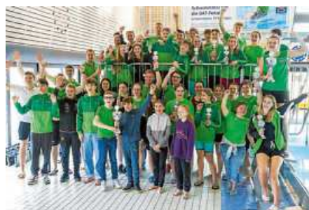
Schwimmfest Nellingen um DAT-Pokale