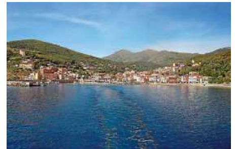
Porto Azzuro (Elba)

Wir trainieren außerhalb der Schulferien immer dienstags ab 19.45 Uhr bis 21.15 im Hallenbad Nellingen: Einschwimmen, dann Schwimm- und Tauchübungen. Anschließend gehen wir zum Taucherstammtisch mit Dekobier, -wein oder -apfelschorle und Erfahrungsaustausch.