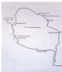
Skizze Wanderweg „Rund ums Schloßle“

Mit dem Wanderweg „Rund ums Schloßle“ will die „Initiative Scharnhausen“, eine Gruppe von Bürger*innen, Scharnhausen attraktiver machen. Die Gestaltung eines Wegs um das Schloßle soll der Einstieg in ein Wanderwegenetz sein, das die reizvolle Lage des Ortes im Körtschal unterstreicht. Dabei soll eine ökologische Aufwertung zum Beispiel durch Blühstreifen und Trockenmauern erfolgen und der Erholungswert unter anderem durch Bänke gesteigert werden. Hinweise auf geologische Besonderheiten und Informationen zu historischen Gegebenheiten werden den Rundweg bereichern.