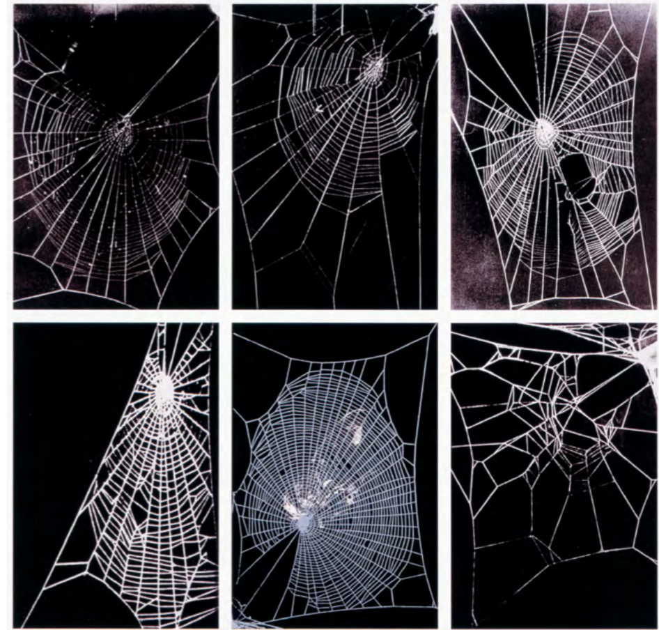
Rosemarie Trockel „What it is like to be you are not“ (Auswahl von 6 Motiven der insgesamt 8-teiligen Edition), 1993 Foto: Archiv, Sammlung LBBW © VG Bild-Kunst, Bonn 2020, eine Leihgabe der Sammlung Landesbank Baden-Württemberg