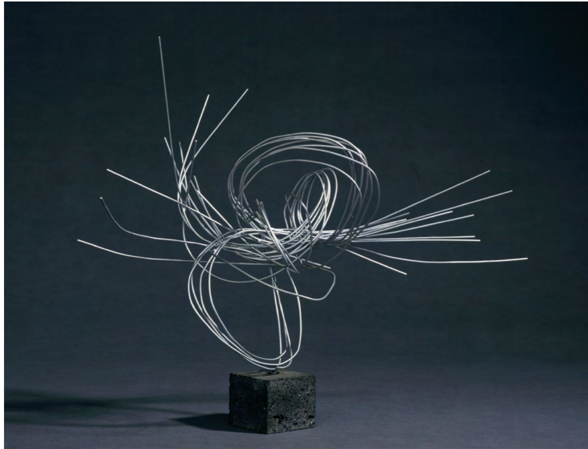
Norbert Kricke „Hornisse“, © Foto: Jürgen Diemer eine Leihgabe des „Lehmbruck Museum, Duisburg“