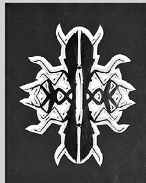
Beate Diao „Mantis I.,II.,III.“, 2017