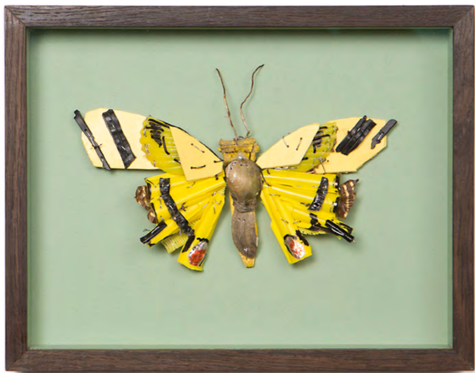
Matthias Garff „Schwalbenschwanz“, 2020