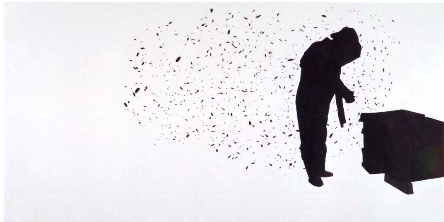
Jeanette Zippel „BIENEnMENSCH Nr. 8“, 2000